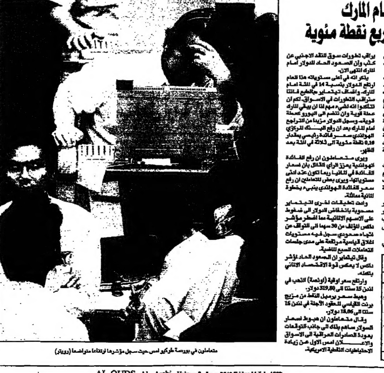
معلمان في يومه طرقت اسس حيث سهل مؤتمرا لارتفاعا متواضعا